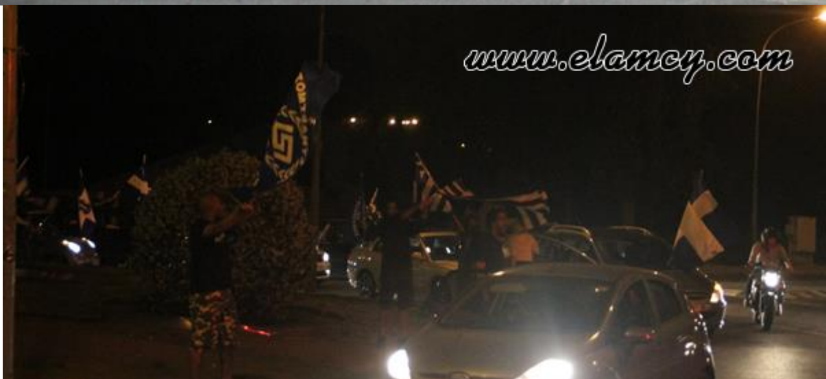
Πανηγυρισμοί ΕΛΑΜιτών για την εκλογή της νέο-ναζιστικής Χρυσής Αυγής στο Ελληνικό κοινοβούλιο, Μάης 2012.